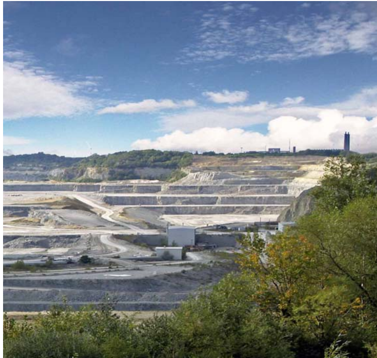
Blick in den Tagebau Rüdersdorf (von Osten)

Am Nachmittag konnten unter Führung der Rüdersdorfer Kultur GmbH interessierte Teilnehmer die Geologie des Kalksteintagebaues live erleben.