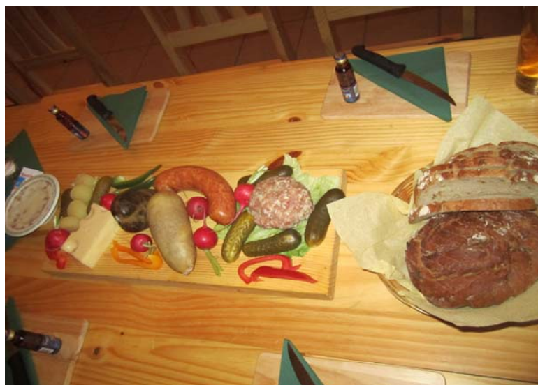
Blick auf ein „Tscherpapassenbrett“, welches von unseren Bergfrauen liebevoll vorbereitet wurde.

Der gelungene Tag fand seinen Ausklang bei einem Bergmannsschmaus mit Bergbier.